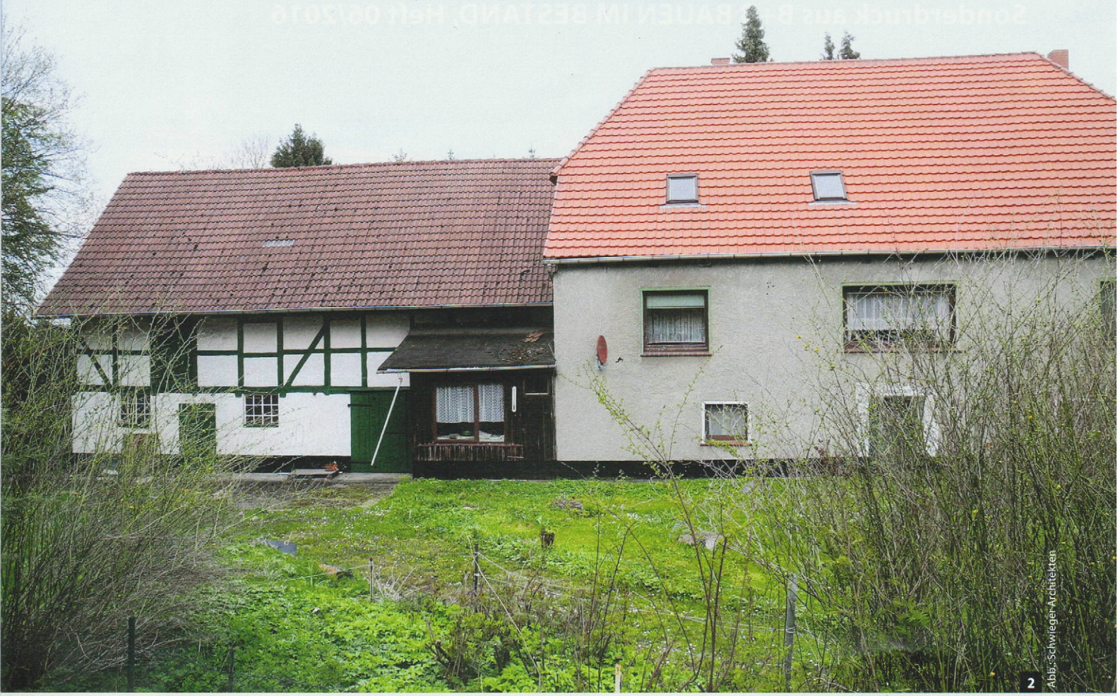
Abb.: Schwieger Architekten